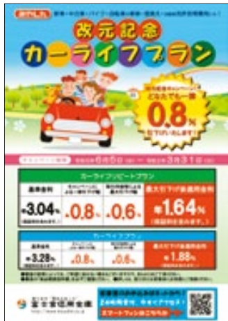
カーライフプラン