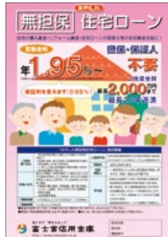
無担保住宅ローン