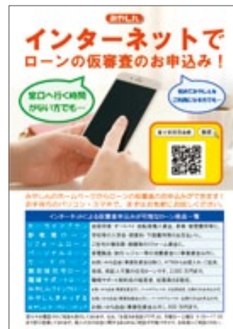
インターネットでローンの仮審査のお申込み!

※商品・サービスは一例です。金利等が変更となる場合がございます。当金庫本支店の窓口またはホームページ等でご確認ください。