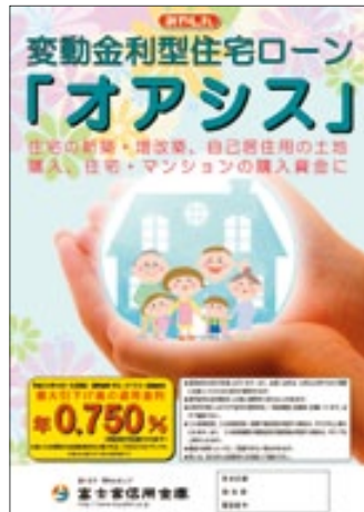
変動金利型住宅ローン「オアシス」